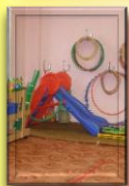
Залы (музыкальный, физкультурный)